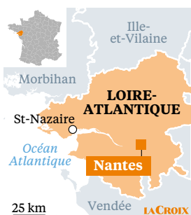
Nantes (Loire-Atlantique) De notre correspondante régionale

Une dizaine de jeunes migrants suivent, depuis février, un ambitieux programme d'initiation au numérique.